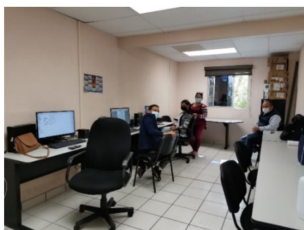
AULA 12-A 300C