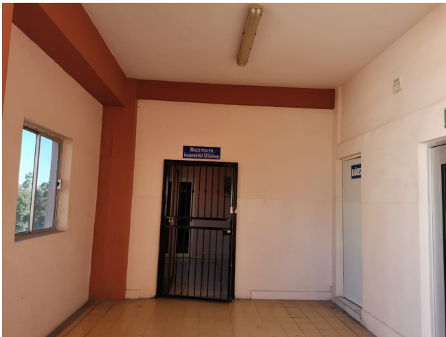
ENTRADA A AULAS 12-A 300A, 12-A 300B Y 12-A 300C